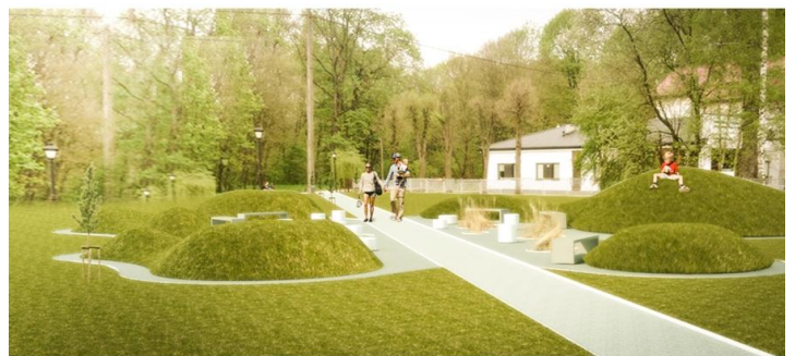
Projekt wykonał Tomasz Pawluś.